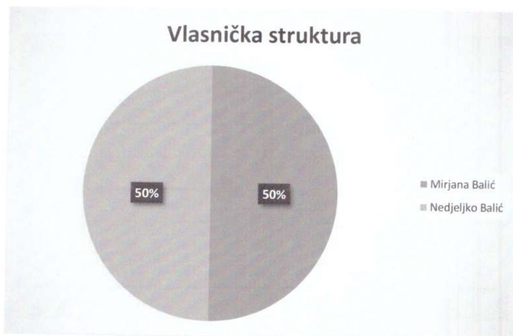
Grafički prikaz: Vlasnička struktura

Tvrtka Grič-automatika d.o.o. je 50% u vlasništvu Mirjane Balić a drugih 50% je u vlasništvu Nedjeljka Balići nakon restrukturiranja tvrtka će biti 100% u vlasništvu Mirjane Balić.